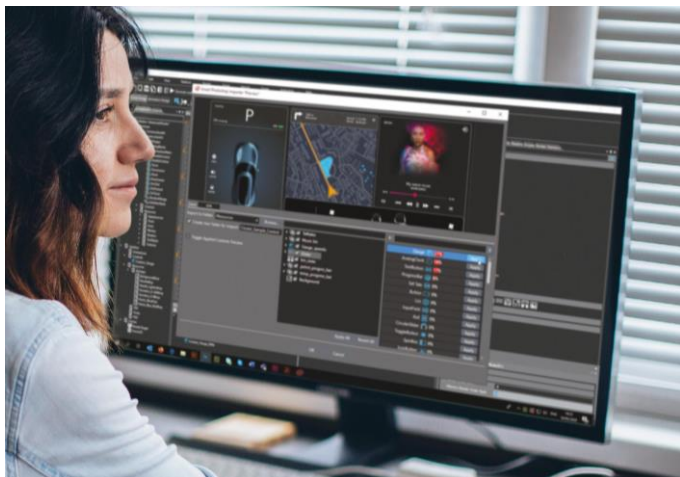
「Smart Photoshop Importer」は UI アートワークをフル機能を備えた HMI に自動的に変換します

革新的な AI 検出アルゴリズムテクノロジーに基づく「Smart Photoshop Importer」は、HMI 作成プロセス全体を高速化します。Photoshop ファイルを「CGI Studio」にインポートするだけで、フル機能を備えた HMI に自動的に変換します。このツールの背景には、AI ベースの UI/UX エlement検出とマッピングテクノロジーが存在し、デザイナーやグラフィックアーティストの作業工数と、コストの削減を実現します。