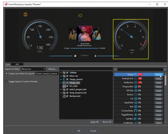
PSD ファイルをインポートして簡単にコントロールに変換

他の HMI デザインツールは、ユーザーが UI アートワークのそれぞれの要素に、手動で機能を追加する必要があります。しかし、カンデラの AI Importer は、この作業を自動的に処理します。CGI Studio に PSD(Photoshop Document)ファイルをインポートするだけで、ゲージ、スライダー、ボタンなどに関連するコンポーネントを検出し、これのそれぞれの要素に最も可能性のある機能を追加します。ここでユーザーが行うことといえば、ダブルチェックと、場合によっては手動での若干の調整だけです。CGI Studio におけるこの AI サポートは時間を大幅に節約するだけでなく、構成プロセスを可能な限り簡略化することにより、デザイナーの創造性も活用します。